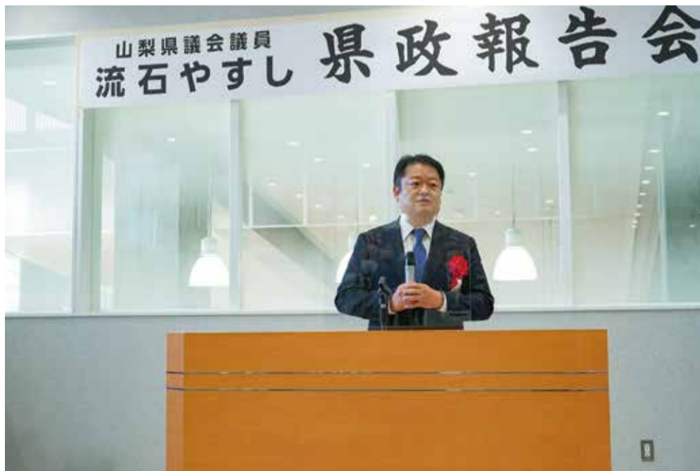
2022年12月18日 長崎幸太郎知事