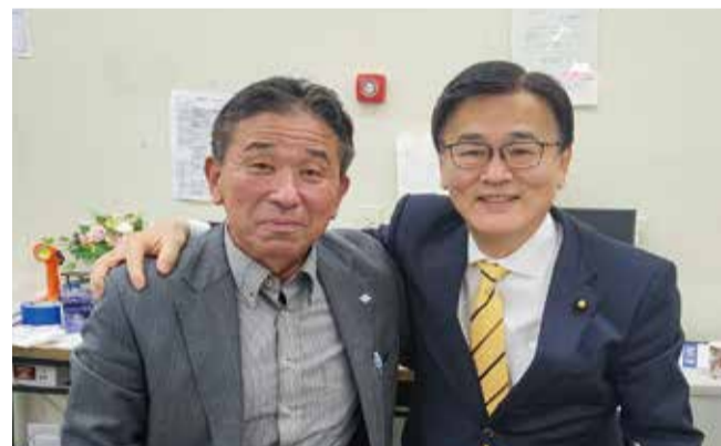
森屋 宏参議院議員と