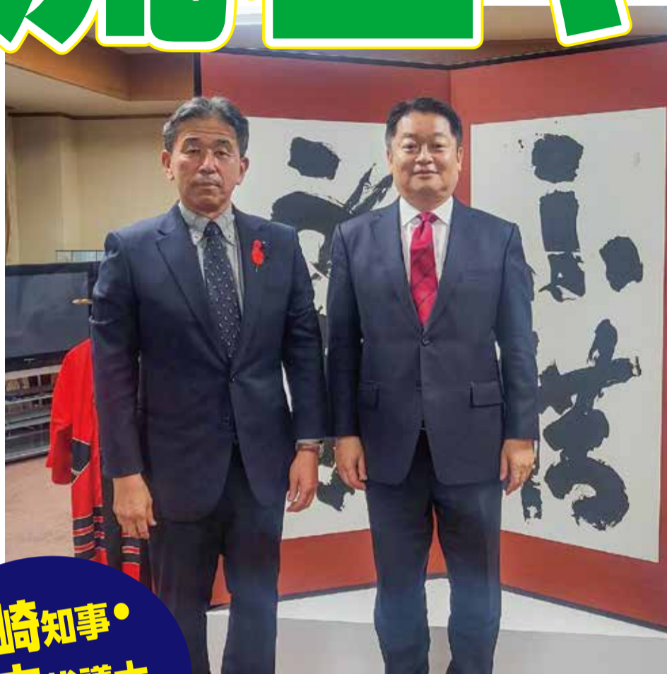
長崎幸太郎知事と