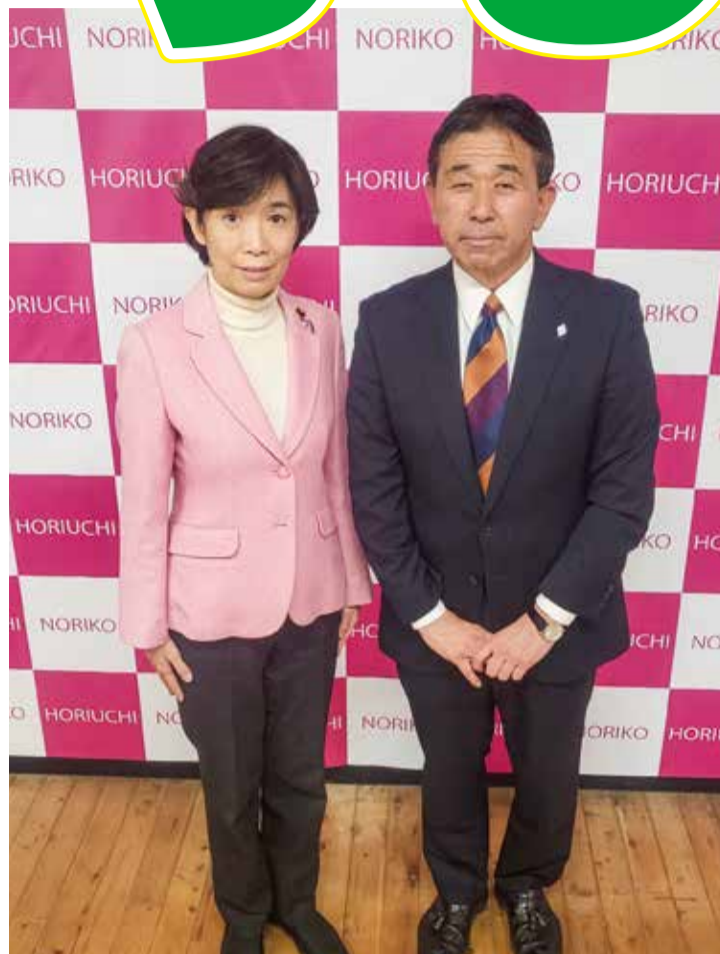
堀内のりこ衆議院議員と