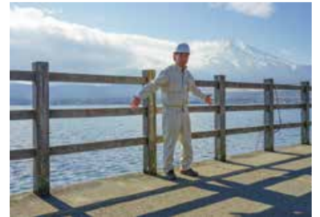
山中湖畔サイクリングロード