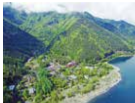
アミューズ本社移転先