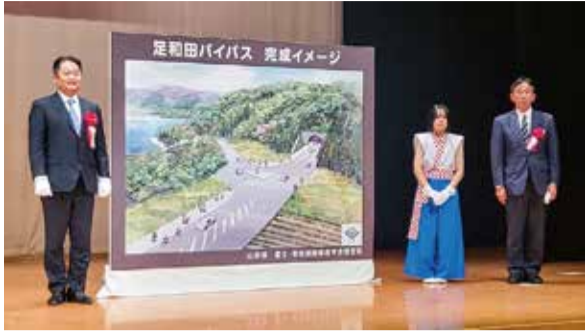
足和田バイパス着手式